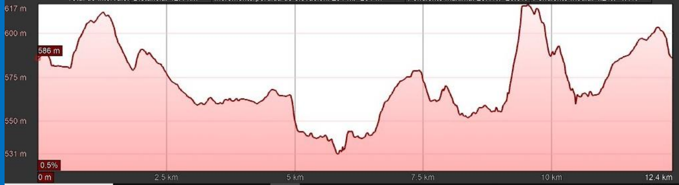
Gráfico: mín., media, máx. Elevación: 531, 573, 617 m Total de intervalo: Distancia: 12,4 km Incremento/pérdida de elevación: 291 m, -291 m Pendiente máxima: 28,1%, -20,8% Pendiente media: 4,2%, -4,1%